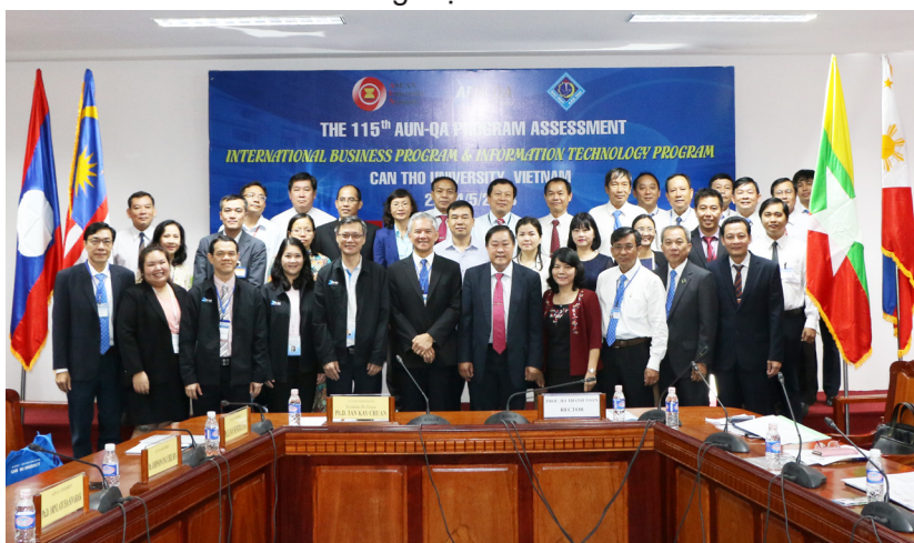
Ảnh lưu niệm với đoàn đánh giá tại buổi bế mạc.

Tại đợt đánh giá ngoài lần này, các chuyên gia đánh giá rất cao tâm huyết và nỗ lực của Trường ĐHCT trong hoạt động đảm bảo chất lượng đào tạo của Nhà trường nói riêng và đồng hành cùng với các hoạt động của AUN nói chung. Những kết quả chứng nhận các chương trình đạt chuẩn AUN cũng như những bài học kinh nghiệm tích lũy được về công tác đảm bảo tiêu chuẩn chất lượng giáo dục khu vực ASEAN trong những lần đánh giá ngoài vừa qua sẽ tạo động lực rất lớn giúp Nhà trường tiếp tục đạt được những kết quả như mong đợi, khẳng định một cách mạnh mẽ chất lượng cũng như uy tín và thương hiệu ĐHCT.