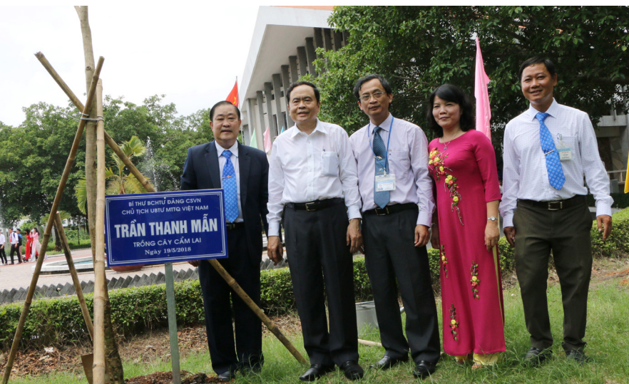
Nhân dịp này, ông Trần Thanh Mẫn, Bí thư Trung ương Đảng, Chủ tịch Ủy ban Trung ương Mặt trận tổ quốc Việt Nam cùng lãnh đạo Nhà trường đã trồng cây lưu niệm phía trước Hội trường Rùa.

lập Hội đồng Trường sẽ góp thêm phần vào việc minh bạch hóa hoạt động quản lý, điều hành của Trường cũng như xây dựng các chiến lược phát triển của Trường ĐHCT trong tương lai. Trường ĐHCT tin tưởng rằng với đội ngũ lãnh đạo, quản lý đã được kiện toàn Trường ĐHCT sẽ thực hiện tốt công tác quản lý và điều hành đơn vị, góp phần đưa Trường ĐHCT lên vị trí và tầm cao mới, chứng tỏ sự phát triển của Trường ĐHCT luôn đồng hành và đóng góp không nhỏ cho sự phát triển của nền giáo dục Việt Nam.