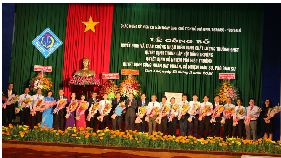
Các thành viên Hội đồng Trường ra mắt đại biểu.

Về công tác đào tạo, Trường đang tổ chức đào tạo 98 ngành/chuyên ngành bậc đại học. Quy mô đào tạo đại học hệ chính quy khoảng 32.000 SV, ngoài chính quy là khoảng 13.000