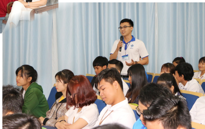
Giao lưu với doanh nhân là cựu sinh viên của Trường.

Chương trình cũng giới thiệu đến sinh viên Giải thưởng tài năng Lương Văn Can do Báo Doanh nhân Sài Gòn tổ chức. Đây là Cuộc thi khởi nghiệp-lập và bảo vệ đề án kinh doanh mang