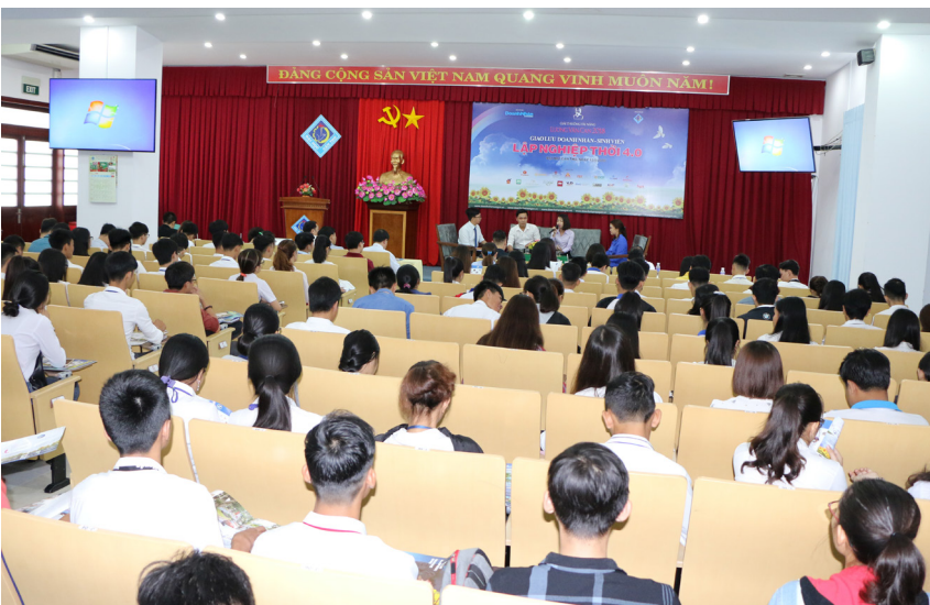
Chương trình phát động khởi nghiệp đổi mới sáng tạo và tọa đàm "Lập nghiệp thời 4.0" diễn ra tại Hội trường 4, Nhà Điều hành, Trường ĐHCT.

Ngày 13/5/2018, tại Hội trường 4, Nhà Điều hành, Trường ĐHCT, Hội Sinh viên và Trung tâm Ươm tạo Doanh nghiệp Công nghệ của Trường phối hợp với Báo Doanh nhân Sài Gòn tổ chức chương trình phát động khởi nghiệp đổi mới sáng tạo trong sinh viên Trường ĐHCT và Giao lưu doanh nhân-Sinh viên lập nghiệp thời 4.0.