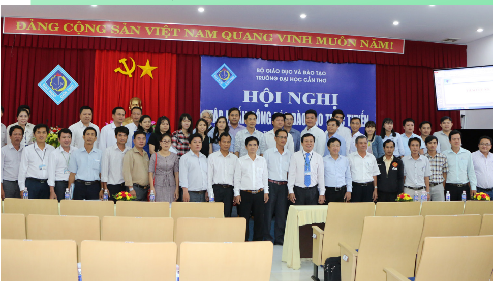
Ảnh lưu niệm.

mô hình đào tạo trực tuyến là một hướng đi mới nhưng cũng là một thách thức đối với công tác đào tạo hệ từ xa hiện nay. Tuy nhiên, các đại biểu tin tưởng rằng mô hình đào tạo trực tuyến đầy hứa hẹn này sẽ là một bước đột phá trong hình thức đào tạo từ xa của Trường ĐHTC và hoàn toàn nhận được sự ủng hộ của các đơn vị liên kết.