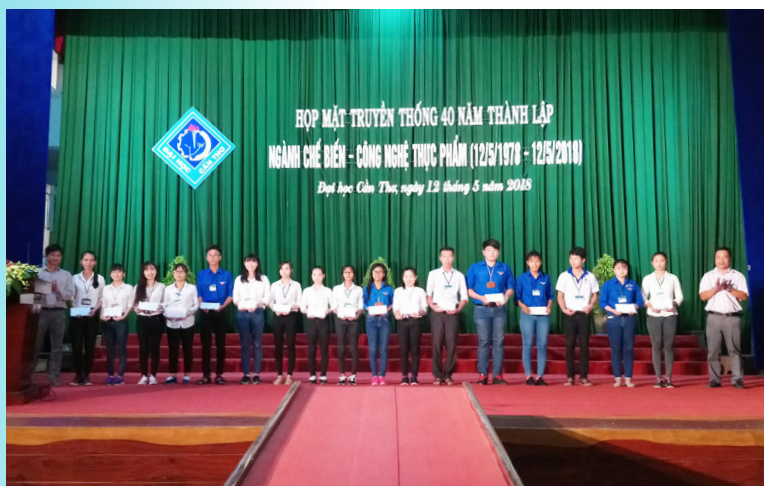
Trao học bổng cho các em sinh viên của ngành Công nghệ thực phẩm vượt khó học tốt.

Phát biểu tại buổi họp mặt, GS.TS. Hà Thanh Toàn chia sẻ Trường ĐHCT là một trong bốn trường hàng đầu của Việt Nam với hơn 50 năm hình thành và phát triển. Trường hiện có khoảng 47.000 sinh viên với gần 2.000 cán bộ, trong đó, có 11 Giáo sư, 139 Phó Giáo sư, gần 400 tiến sĩ với đội ngũ cán bộ trình độ cao nhằm mục tiêu không ngừng đảm bảo và nâng cao chất lượng đào tạo. Đặc biệt, Trường đang triển khai thực hiện Dự án Nâng cấp Trường ĐHCT sử dụng vốn vay ODA của Chính phủ Nhật Bản với tổng số vốn là 105 triệu USD nhằm nâng cấp Trường ĐHCT thành trường đại học xuất sắc, đạt chuẩn quốc tế về đào tạo, nghiên cứu khoa học, chuyển giao công nghệ và quản trị đại học. Đây là nguồn lực quan trọng để xây dựng Trường ĐHCT lên đẳng cấp mới, ngang tầm với các trường đại học trong khu vực và thế giới.