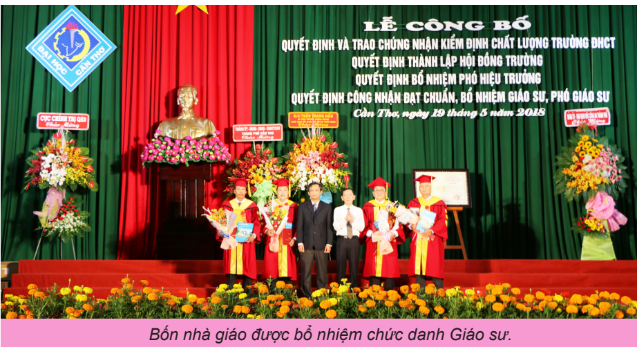
Bốn nhà giáo được bổ nhiệm chức danh Giáo sư.

Việc kiểm định theo tiêu chuẩn của Bộ GD&ĐT, Bộ tiêu chuẩn kiểm định gồm 10 tiêu chuẩn với 61 tiêu chí đánh giá các hoạt động