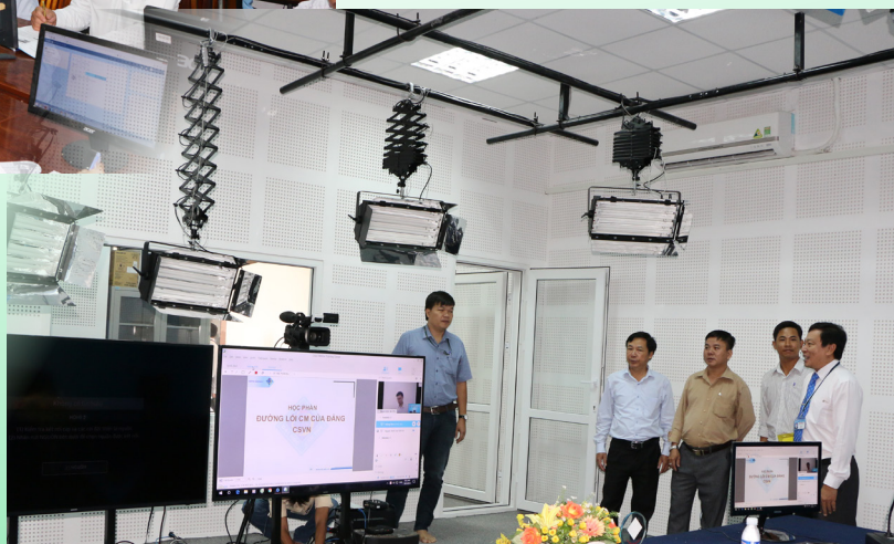
Tham quan Phòng truyền thông đa phương tiện dành cho giảng viên.

Hiện tại, tổng số ngành đào tạo từ xa của Trường năm 2018 là 18 ngành. Sinh viên đủ điều kiện tốt nghiệp khi