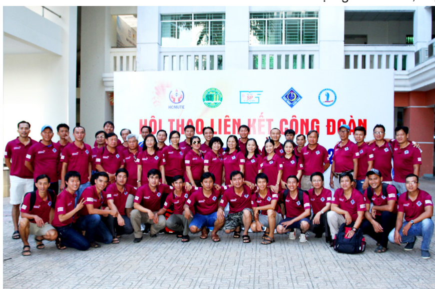
Đoàn vận động viên Công đoàn Trường ĐHCT tại Hội thao.

Qua 02 ngày thi đấu sôi nổi, đầy quyết tâm của các đội, Hội thao đã kết thúc thành công tốt đẹp với kết quả toàn đoàn như