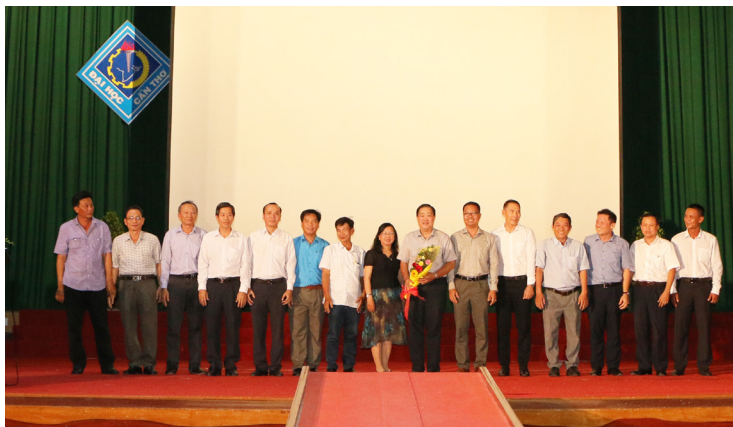
Ban Chấp hành Hội Cựu sinh viên liên ngành Công nghệ thực phẩm - Công nghệ sau thu hoạch nhiệm kỳ 2018-2020.

Buổi hợp mặt nhân dịp kỷ niệm 40 năm ngày thành lập ngành Chế biến-Công nghệ thực phẩm nhằm tạo điều kiện cho các thầy, cô giáo và sinh viên các khóa có dịp gặp nhau để ôn lại những kỷ niệm buồn vui khi còn trên giảng