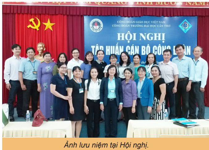
Ảnh lưu niệm tại Hội nghị.

đã nhấn mạnh vai trò của công đoàn trong hệ thống chính trị của Nhà trường. Với mong muốn xây dựng đội ngũ cán bộ công đoàn ngày càng năng động, sáng tạo và chuyên nghiệp, Ban thường vụ Công đoàn nhân cơ hội này đã lắng nghe những ý kiến đóng góp của các cán bộ trực tiếp làm công tác công đoàn tại đơn vị, tiếp xúc thường xuyên với viên chức người lao động để biết được tâm tư, nguyện vọng, tình cảm đối với hoạt động công đoàn. Từ đó, Công đoàn Trường có những điều chỉnh hợp lý, góp phần thực hiện tốt nhiệm vụ, phát huy vai trò, trách nhiệm của Công đoàn vì sự phát triển Nhà trường.